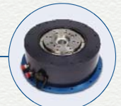
有框直接驱动旋转电机