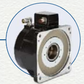
模块化直接驱动旋转电机