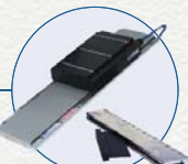
直接驱动直线电机